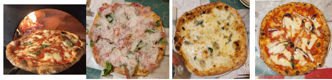
今回いただいた4種類のPizza

日時 2024年2月2日18:00～21:00 場所 千葉県千葉市稲毛区にある「Perte」 参加者 友電会 会員等 12名