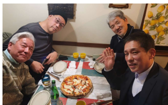
マスターお薦めのPizza