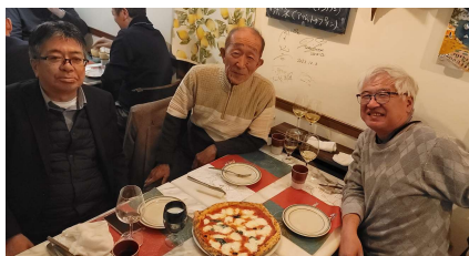
絶品！！ マルゲリータ500