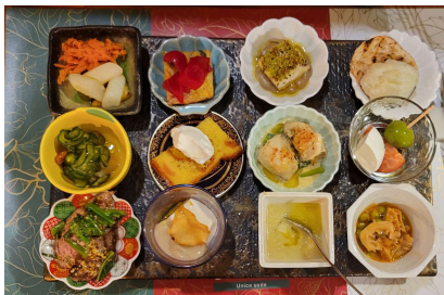
千葉産の食材をベースに1品ずつ作った12種類の前菜

内容 「Perte」で前菜から始め4種類のPizzaとデザートと美味しいワインと共にいただきました。 特にナポリピッツァ職人世界選手権カブトカップ日本大会2018のマルゲリータ又はマリナーラの技術を競うSTG部門で優勝した経歴を持つ。 STG部門にて全審査員が唯一満点の500点をつけて優勝したことから名づけられたマルゲリータ500は絶品です。皆さんでいただきました。