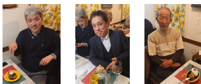
デザートも美味しい