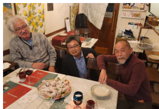
ピアンカネーヴェ